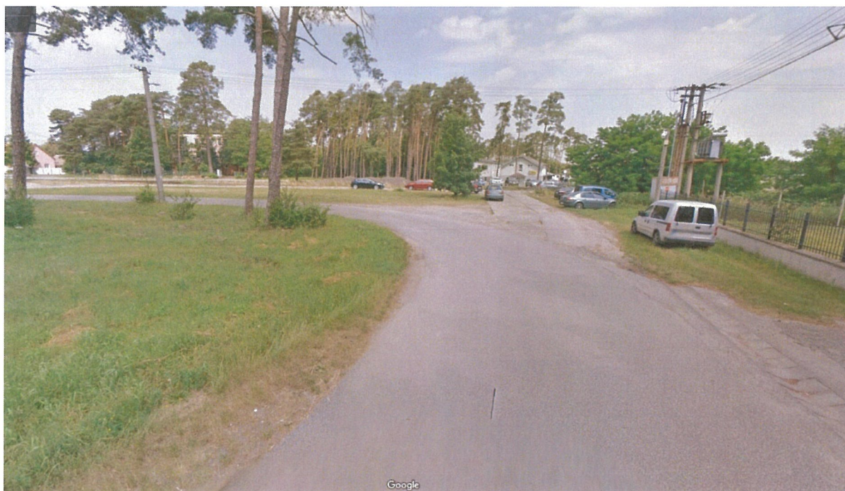
Kamera č.12: Práčovňa - presunutá na križovatku Potočná Vendelínska (nutné zhotoviť nameranú prípojku z rozvodu NN siete)