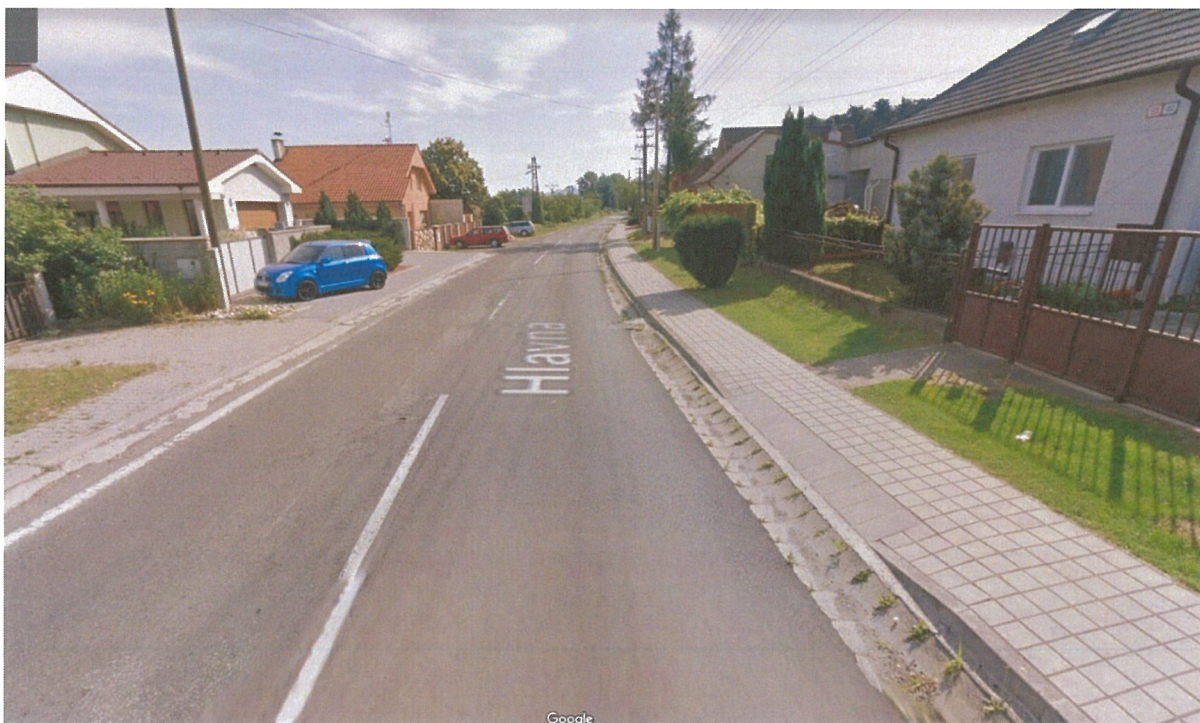
Kamera č.14: Námestie „Jelšová“ (nutné zhotoviť nameranú prípojku z rozvodu NN siete)