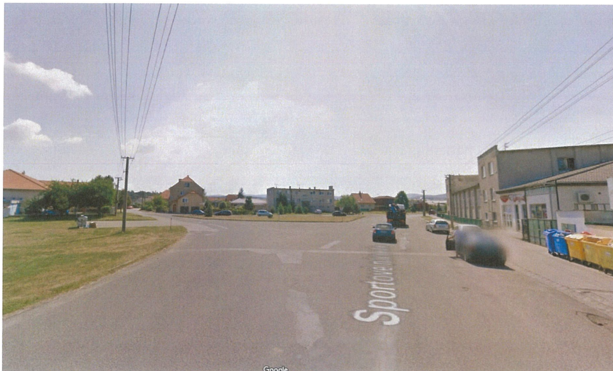
Kamera č.4: Areál ŠK (napájanie možné z budovy ŠK Lozorno)