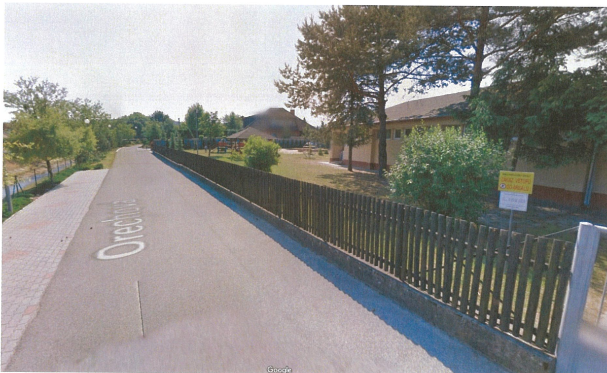
Kamera č.10: Ihrisko (pripojiť na existujúcu nameranú prípojku z rozvodu NN siete)