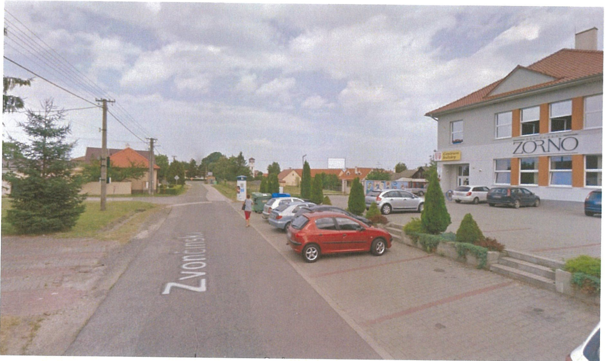
Kamera č.8: Cintorín (napájanie možné z budovy Domu smútku, nutné osadiť stĺp na rohu vpravo)