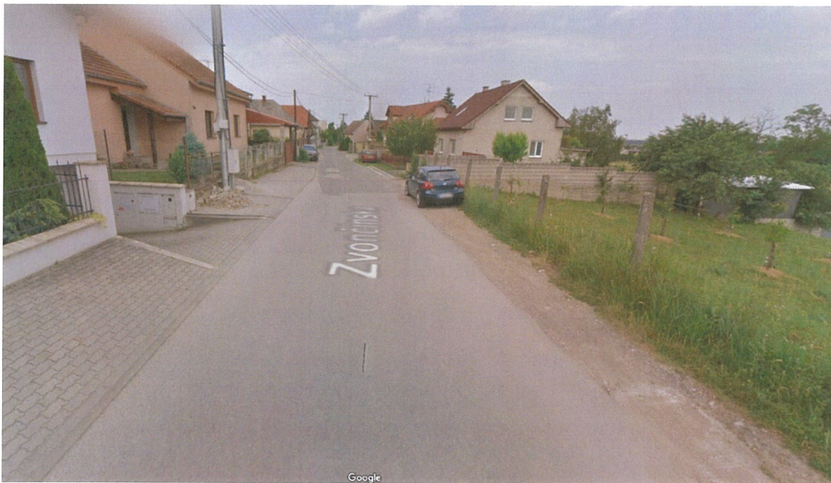
Kamera č.16: Poľnohospodárske družstvo - kamera zrušená.