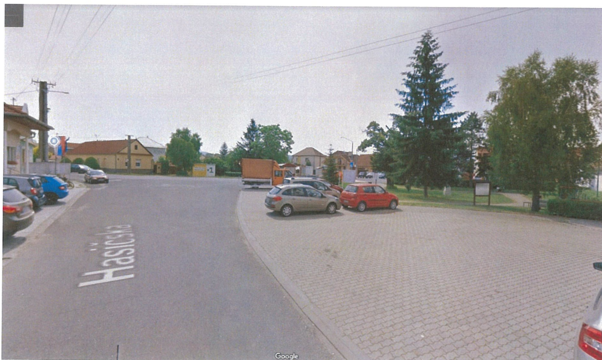
Kamera č.6: Dvor obecného úradu (napájanie možné priamo z budovy Obecného úradu Lozorno)