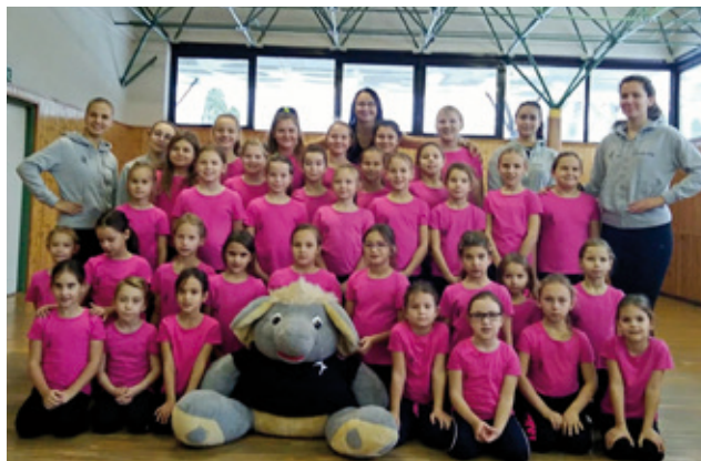
Sústredenie v Moravskom sv. Jáne

Tento školský rok máme v súbore 48 detí a musíme sa pochváliť, že máme v súbore aj jedného chlapca, čo je veľká vzácnosť každého mažoretkového súboru. Tiež nám tento rok narástol počet mamičiek v našom Happy Moms tíme, a to na 18 mamičiek. Sme hrdé, že stúpa záujem o mažoretky nielen z radov detí ale aj mamičiek.