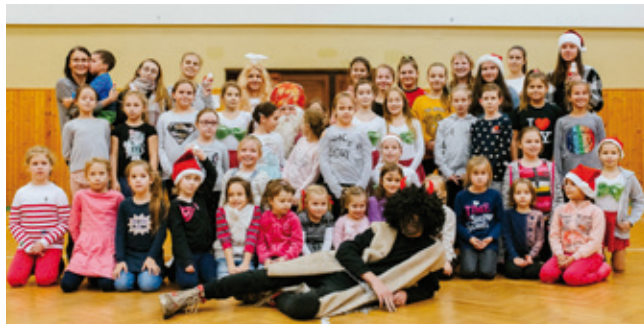
Naše stretnutie s Mikulášom