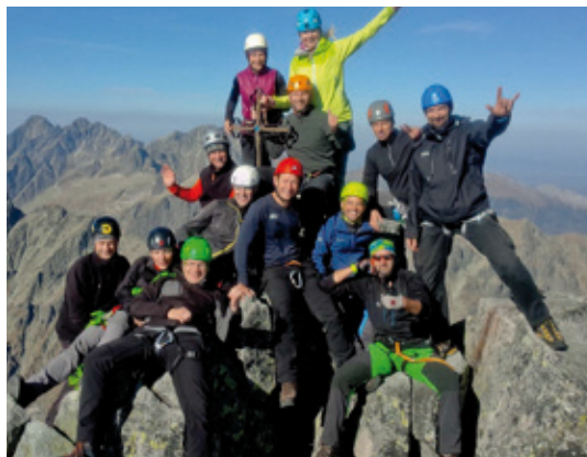
Na Gerlachovskom štíte