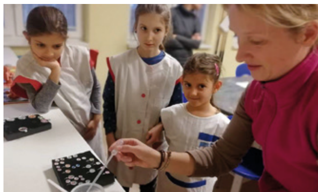
Oblúbený kurz výroby šperkov