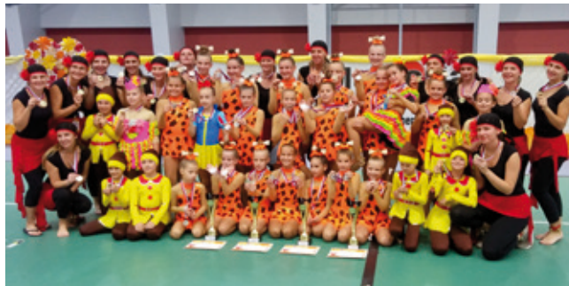
Úspešné „ťaženie“ v Púchove

Áno, tento školský rok 2018/2019 oslavujeme my, Mažoretky SOFFI Lozorno, už desiate výročie od vzniku nášho súboru. Veľmi sa tešíme, že náš súbor sa z roka na rok stále rozrastá o nové a nové členky a že sa nám darí stále viac a viac sa umiestňovať na medailových miestach na mažoretkových súťažiach nielen na Slovensku ale aj v Čechách.