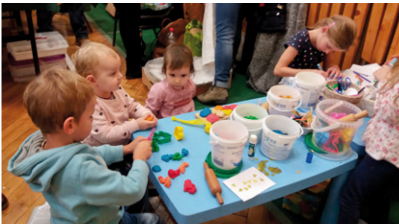
Tvorivé dielničky počas jarmoku

„Ošetrovanie detí v domácom prostredí“ – prednáška zdravotnej sestry, ktorá prináša praktické tipy ako si poradiť v domácom prostredí s najbežnejšími úrazmi a zdravotnými ťažkosťami detí. Termín upresníme.