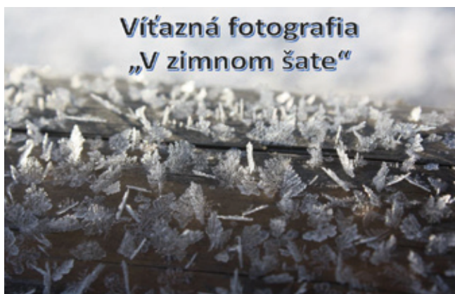
Fotografia „Snehové vločky“ dostala najviac hlasov

I tento rok bol Lozorňáček súčasťou vianočného „Lozorského všelico“, na ktorom sme ponúkli detičkám možnosť kreatívne sa vyžiť. Deťúrence neotálali a zdobili si medovníčky, vianočné pohľadnice a plastelínovali. V stánku si návštevníci mohli pochutnať na skvelých lokšiach a voňavej kávičke.