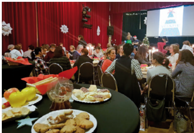
Cítili sme sa ako veľká rodina

chránenej dielne. Tým sa akcia rozšírila aj o charitatívny rozmer. Vyzbieraných 104 Eur bolo venovaných jednej rodine z Lozorna v ťažšej sociálnej situácii.