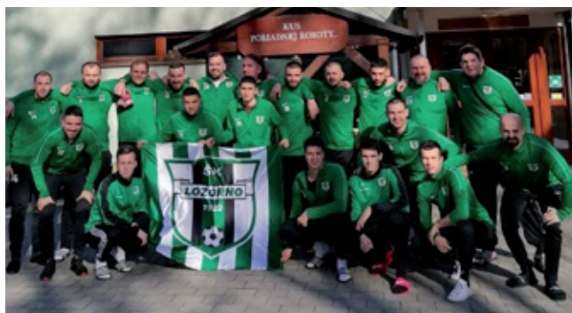
Sústredenie A mužstva Podkylava, Myjavské kopanice.

Výborný kolektív a pohoda v tíme sa premietla aj do tabuľky, kde po jesennej časti mužstvo figuruje na 1. mieste so ziskom 26 bodov. Dominuje najmä v domácich stretnutiach, v ktorých všetky zápasy vyhralo. Veríme, že v dobrých výkonoch bude aj naďalej pokračovať a atraktívnym herným prejavom pritiahne na náš štadión čo najviac fanúšikov aj v jarnej časti súťaže.