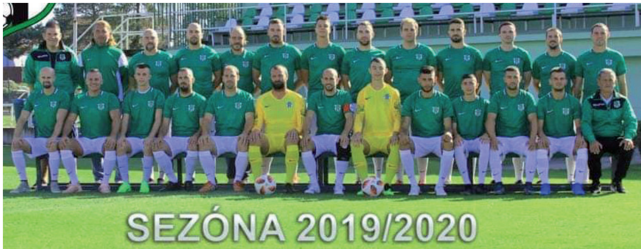
Oficiálne foto mužstva v sezóne 2019/2020