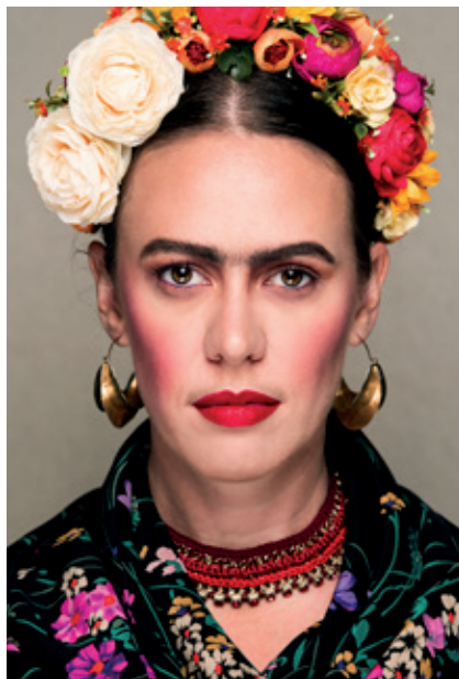
Premena na Fridu Kahlo

Pamätáte si svoju prvú spoluprácu, svoj prvý projekt?