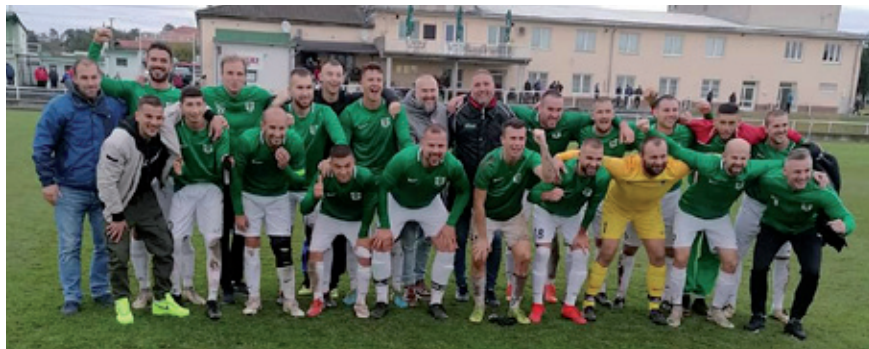
Sme jesenní majstri!