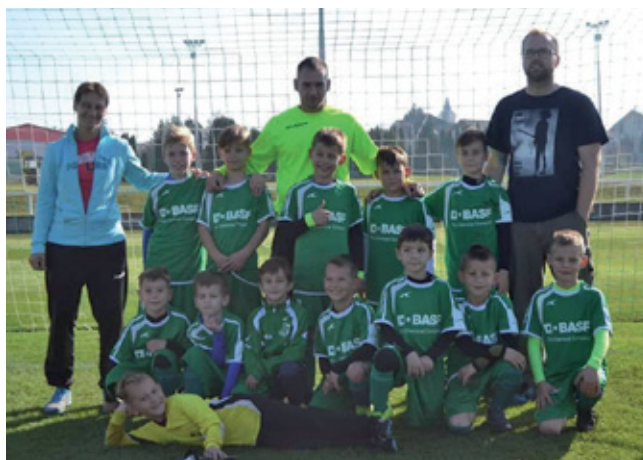
Naša prípravka, kategória U9.