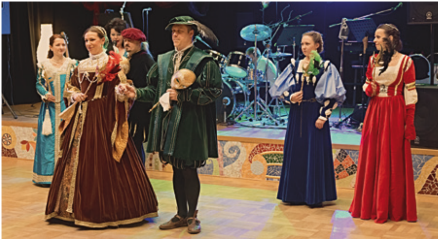
Skupina historického tanca Galthilion

V poradí už 9. obecný ples sa konal koncom januára v Centre kultúry Lozorno. Po úvodnom slávnostnom otvorení plesu starostom obce nám skupina historického tanca Galthilion predviedla ukážku dobových tancov. Tance v ich repertoári pochádzajú z prostredia kráľovských a šľachtických dvorov Francúzska, Španielska, Talianska, Nemecka, Anglicka a Čiech aj z prostredia slávností mešťanov a prostého ľudu. Tance šľachty zo 16. storočia, ktoré predviedli u nás, boli už tance na veľmi vysokej úrovni, tanec sa stal uznávaným umením a taneční majstri boli veľmi vyhľadávanými a významnými osobnosťami.