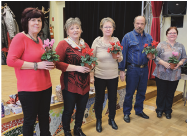
Naši 60 roční jubilanti