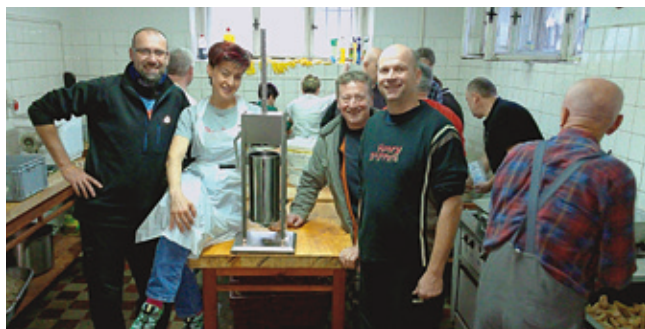
Kuchynka bola plná šarmantných pomocníkov

Začali sme už v stredu. Poumývali a pripravili kuchynku. Vo štvrtok sme si spoločne poplakali pri krájaní cibule a cesnaku. Chlapi chystali mäso a rohlíky. V piatok už od skorého rána sa dymilo z 12 kotlov. Pomáhala každá ruka - noha, veď aj roboty bolo dosť. Spokojní a unavení sme sa rozlúčili.