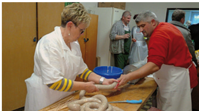
Pri pripravách pomáhala každá ruka - noha

Ďalšou našou tradičnou akciou býva Zimný turistický zraz . Tentokrát si ho zobrali pod patronát Kysučania, kde sme sa vypravili v hojnom počte. Všetko bolo dokonale pripravené, bežkárske trate viedli malebnými samotami, sprievodný program, či už uvítací alebo rozlúčkový bol nezabudnuteľný. Ďakujeme, Oščadnice.