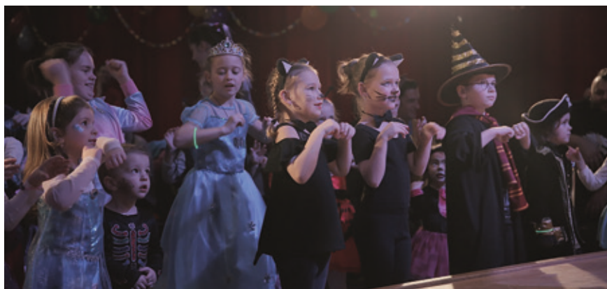
Na karnevale bolo veselo