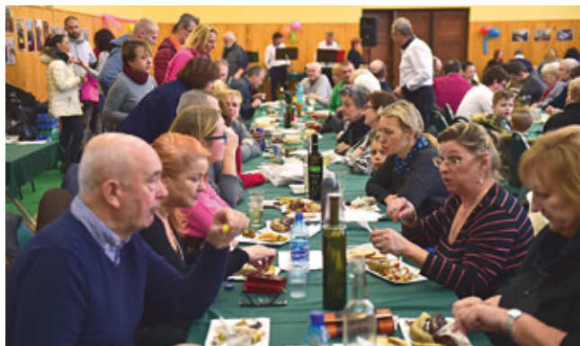
Na zabíjačkových špecialitách si pochutili všetci

Tak ako je dobrým zvykom, začali sme rok 2018 výročnou schôdzou. Uskutočnil sa zápis nových členov, zaspomínali sme na minulý rok, a aby sme nezabudli, prečo sme tu, tak sme sa aj dobre zabavili a zatancovali si. Ale nie príliš dlho, lebo naše sily sme šetrili na Obecnú zabíjačku . Bol to náš šiesty ročník a my turisti, my to máme radi, keď je „šeko na poriadku“.