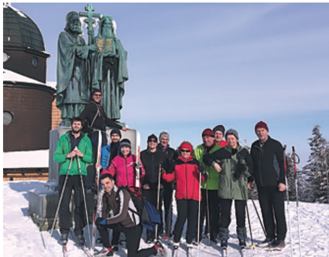
Ani v zime neleníme, na bežky sa postavíme...