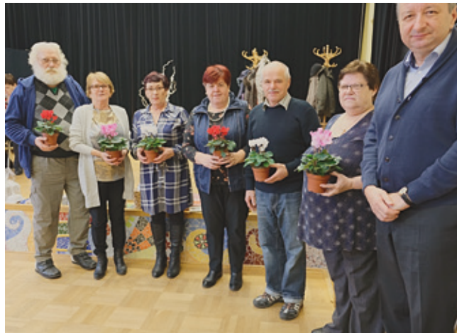
65 roční oslávenci

Do rúk nám vložili krásny kvet a pripravili pohostenie. Iste, nie jednému už doma zvädol kvet od najdrahších gratulantov i oschla slza dojatia. Teraz sme mali opäť tú možnosť precítiť, že nás má niekto rád, že sme tu všetci rovnocenní priatelia.