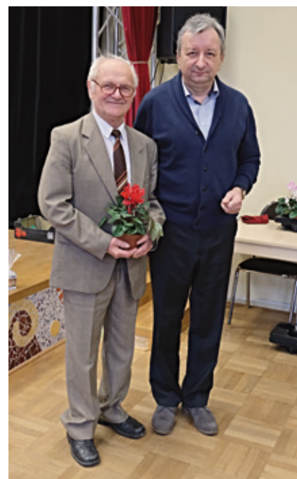
80 ročný oslávenc